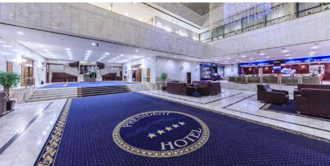
Москва, ул. Б. Якиманка, д. 24